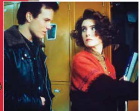
James Marshall y Lara Flynn Boyle en Twin Peaks , 1990.