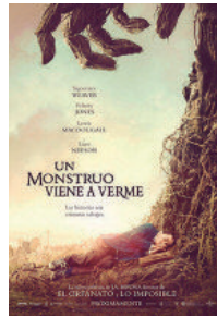
Un monstruo viene a verme