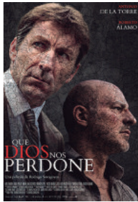
Que Dios nos perdone