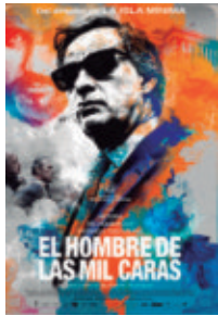
El hombre de las mil caras