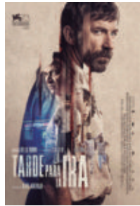
Tarde para la ira